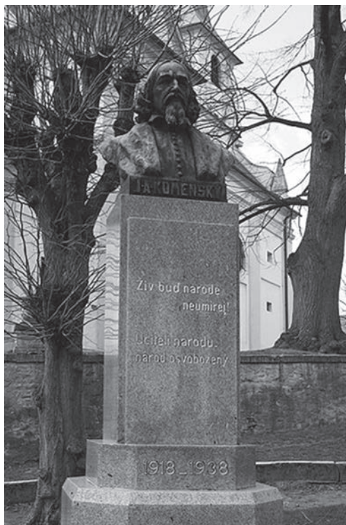
Busta Jana Amose Komenského v Náměstí nad Oslavou.

Protože mi stránkový rozsah tohoto článku neumožňuje náležitě se s těmito postoji vypořádat, nabídnu čtenáři aspoň následující konstatování. Dějiny filosofie, vědy a kultury (včetně výtvarného, slovesného i hudebního umění) jsou plné příkladů životodárné inspirativní role minulosti, která v dílech tvůrčích současníků rozkvétá novým životem. Minulé výdobytky myšlení a tvorby nejsou něčím mrtvým, nýbrž mohou být živoucím zdrojem naší současnosti,